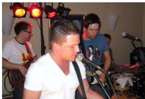
finaleband: Husbandet sto for partymusikken etter festmiddagen.