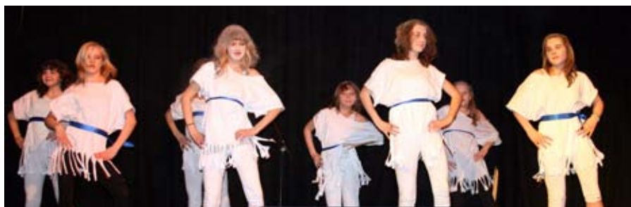
dans: Dansende jenter viser solidaritet i Sogn og Fjordane.

tekst: egil hofsl