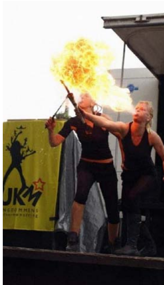
action & parade: det spruter som regel både ild og energi av UKM-paraden.