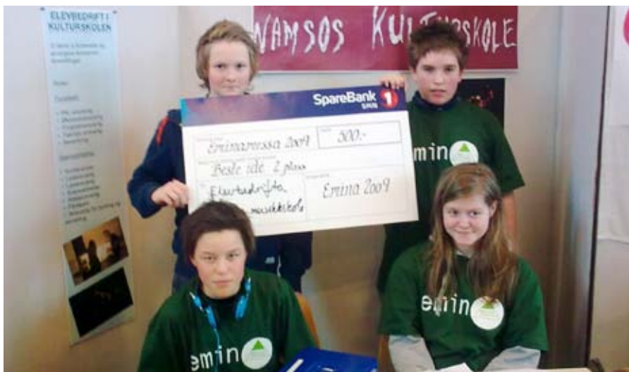
stolte entreprenører: Elever ved Namsos kulturskole har gjort suksess med sine prestasjoner i fagtilbudet entreprenørskap.

– Vi setter fokus på praktiske tilnæringsmåter i forhold til det å stå som arrangør. Elevene får opplæring i hvordan en jobber med lys og lyd, organisering foran og bak scenen, PR og management. De får innblikk i det å drive en bedrift, i