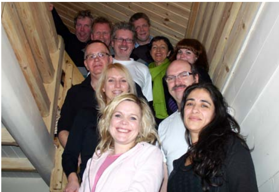
intens og krevende: Store deler av Drømmestipendet-juryen samt prosjektleder og -sekretær i en pause i juryarbeidet.