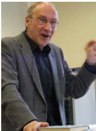
åpningsforedrag: "Mennesket lever ikke bare av brød alene" med Inge Eidsvåg.