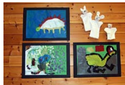
visuell kunst: Billedkunst kan også være solidaritetsarbeid.