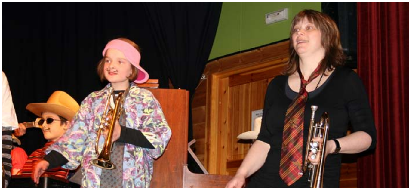
musikk: Musikere fra Fjaler og Hyllestad viser solidaritet.